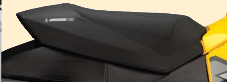
СИДЕНЬЕ КОМПЛЕКТАЦИИ X