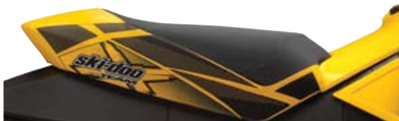
ЛОГОТИП X - 860200236