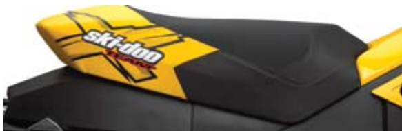
ЛОГОТИП X - 510004877