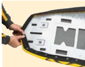
СИСТЕМА ГОТОВЫХ ОТВЕРСТИЙ В ОСНОВАНИИ СИДЕНЬЯ И КРЕПЛЕНИИ